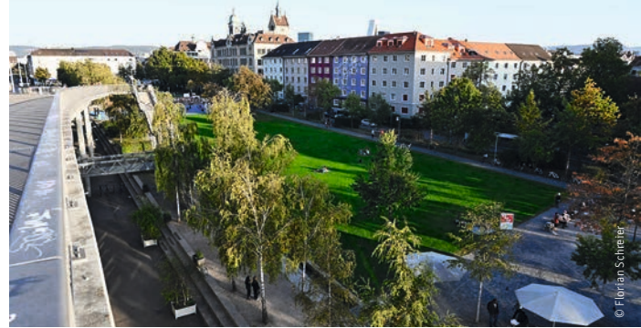
Die Dreirosenanlage wäre jahrelang nicht nutzbar.

Die 100 000 Unterschriften für das Referendum gegen den Autobahn-Bauwahn sind ein deutliches Zeichen. Gleichzeitig liegen aus Basel, Birsfelden und Muttenz weit über 200 Einsprachen gegen den Rheintunnel vor. Während der öffentlichen Planauflage Ende 2023 haben sich viele Betroffene beim VCS bei-